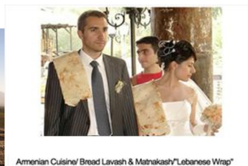
Armenian Cuisine/ Bread Lavash & Matnakash "Lebanese Wrap"