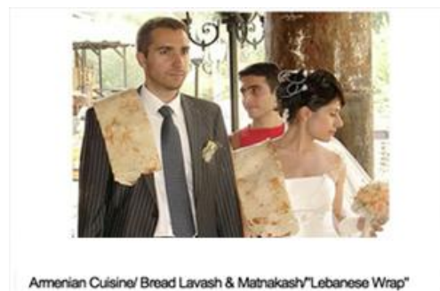
Armenian Cuisine/ Bread Lavash & Matnakash "Lebanese Wrap"