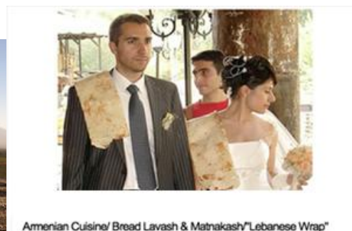
Armenian Cuisine/ Bread Lavash & Matnakash/Lebanese Wrap